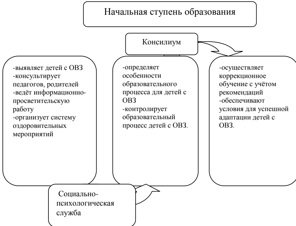
Схема. Механизм взаимодействия структурных подразделений школы