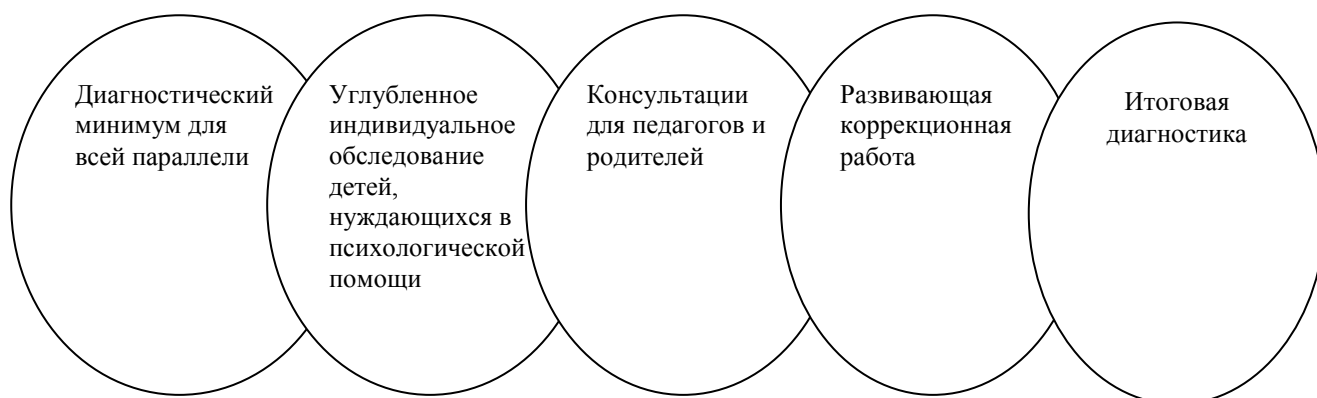
Схема. Механизм реализации программы